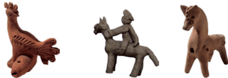
patrimoniul MTR foto George Dumitriu